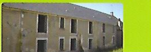
Rénovation totale de la façade et des ouvertures