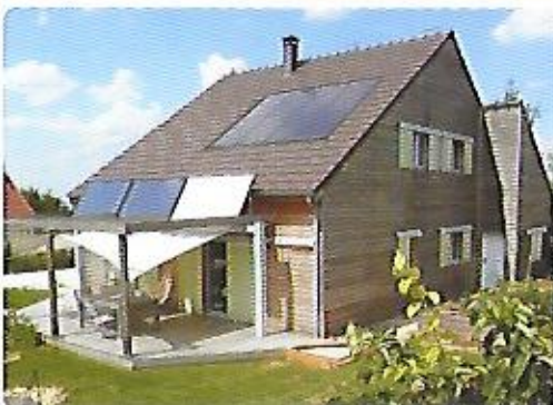
Une réalisation exemplaire transposable à la rénovation