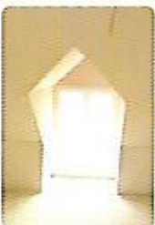
Aménagement et isolation des combles