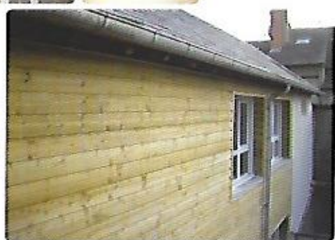
L'isolation par l'extérieur pour une performance optimale